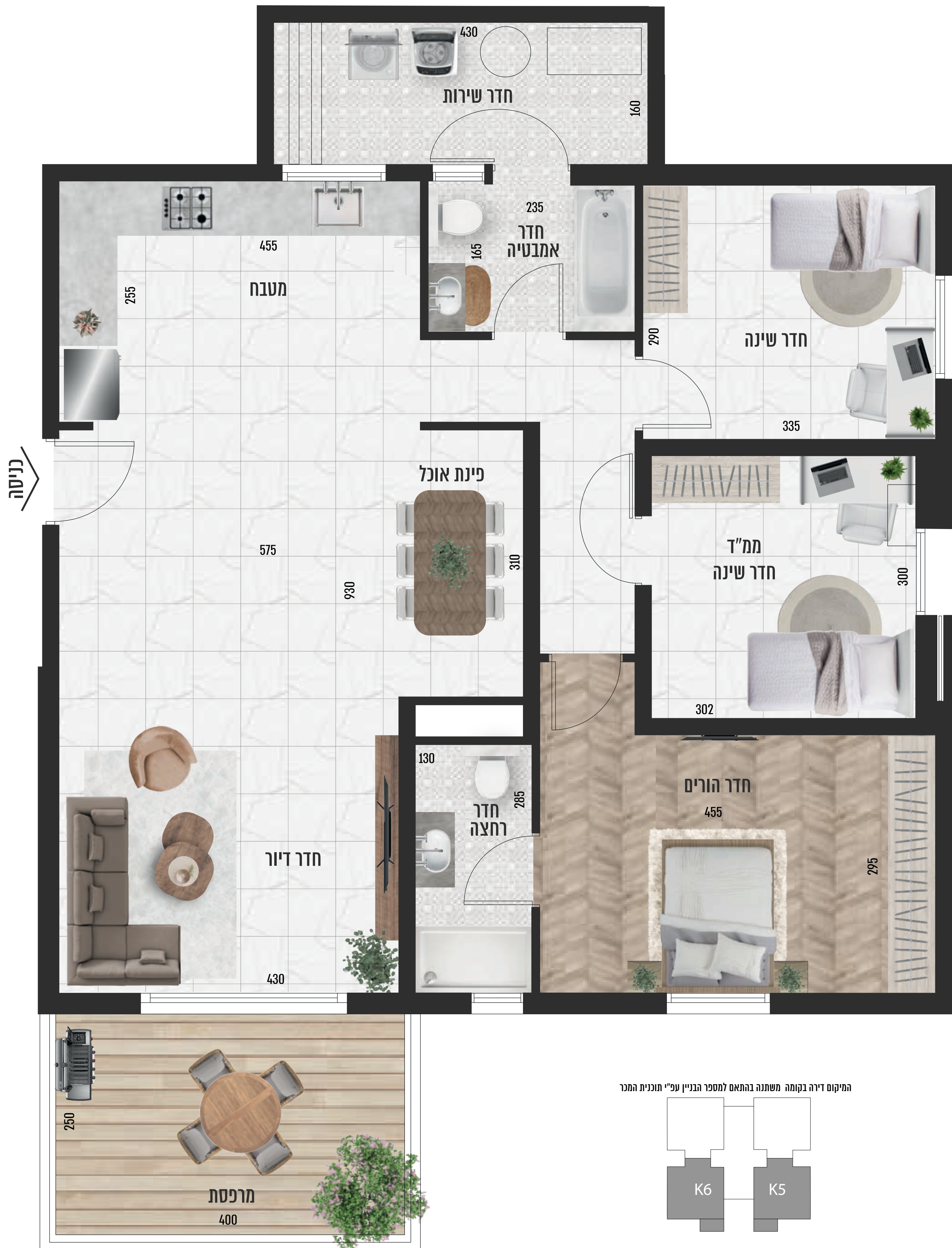
המיקום דירה בקומה משתנה בהתאם למספר הבניין עפ"י תוכנית המכר

מגרשים 2160, 2140, 2270, 2080, 2200, 2040, 2210, 2000, 2220 בניינים 5, 6 | קומה 0 | דירות מספר 9, 10, 16-20, 24-28, 31-34, 37-40 שטח דירה 117.41 מ"ר | שטח מרפסת 13.57 מ"ר